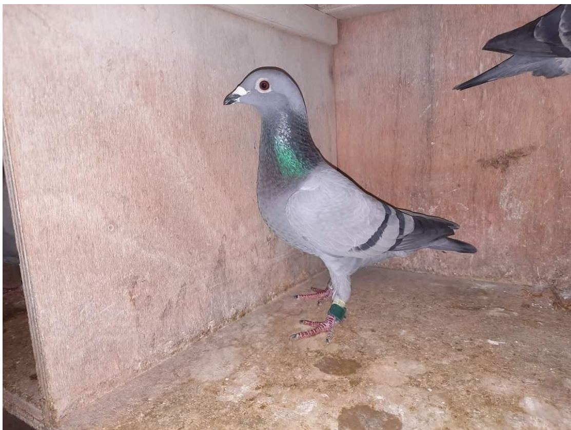
“Maan”, glorieus overwinnares openingsvlucht Niergnies