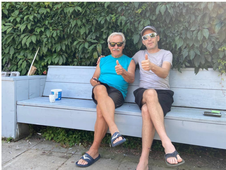
Duimpies omhoog, na het zien van de meldingen op Compuclub Live