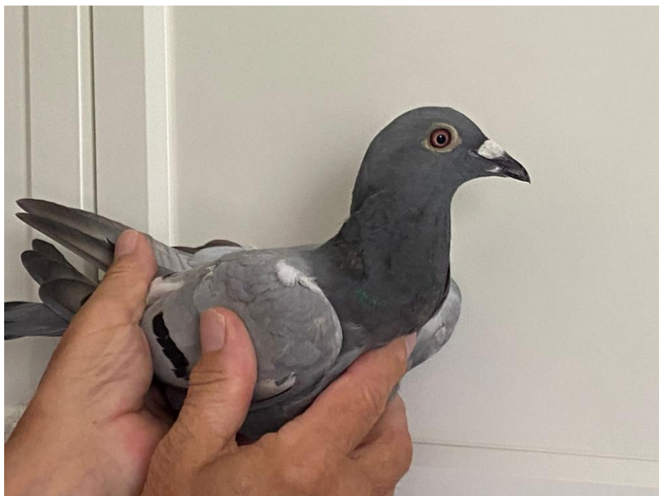
Melun-winnares 23-148 "Estrella"