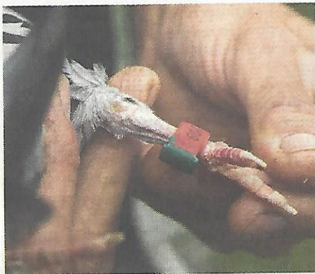
Alle duiven worden geringd met een nummer; alleen de toppers krijgen een naam.