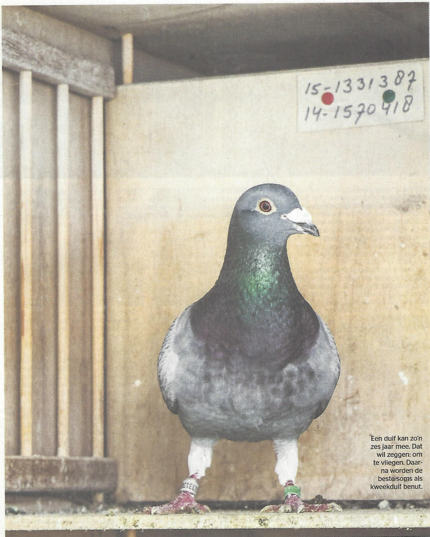
Een duif kan zo'n zes jaar mee. Dat wil zeggen: om te vliegen. Daarna worden de beste soms als kweekduif benut.