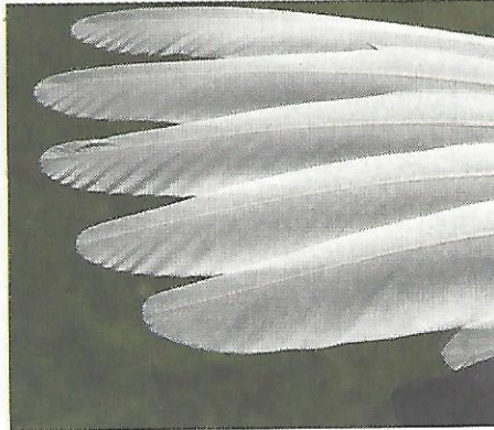
Mooie witte pennen, oftewel veren.